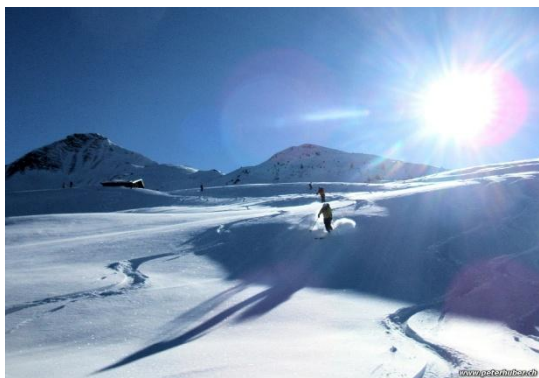
Bilder von 2025