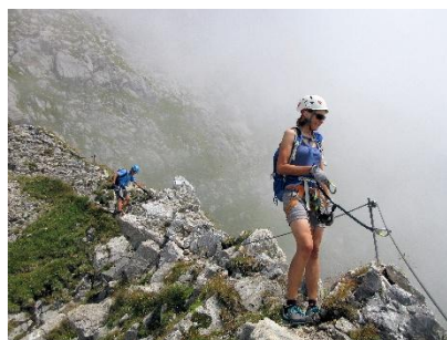
Bilder von Juli 2022

Nachdem Berg+Ski im 2019 diesen Klettersteig letztes Mal besucht hat, wollen wir ihn erneut ersteigen.