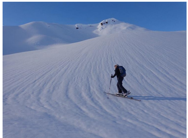
Carole mit Gämpiflua im Hintergrund

Kosten: Fahrentschädigung nach Ansätzen von Berg & Ski CHF 37.- Mitglieder, CHF 50.- Gäste. Tourenbeitrag CHF 5.- Mitglieder, CHF 10.- Gäste