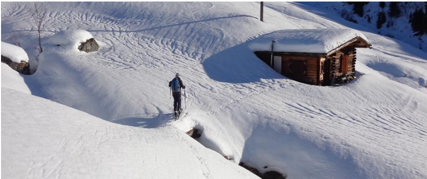
Reko Dez. 2023