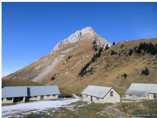
Bilder von 25. November 2018