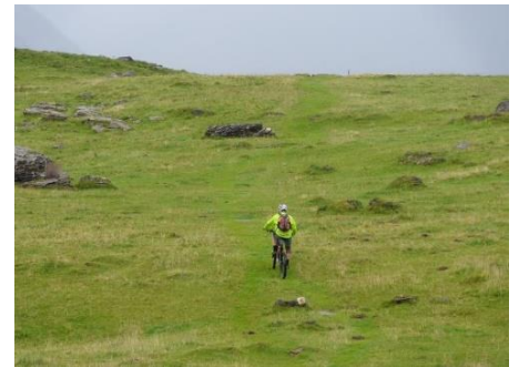
Genussbiken über die Selamatt, Juli 2023

Ausrüstung: Wanderausrüstung, Sonnenschutz (Brille, Hut, Sonnencreme), Regenschutz, Halbtaxabo / GA Mountainbiker-Ausrüstung.