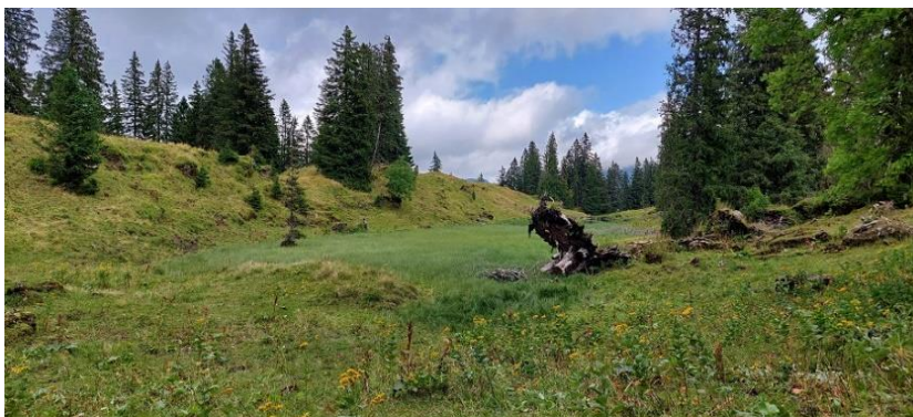
Sagenweg, Juli 2023

Markus Werdenberg, 079 656 74 32, rm.werdenberg@bluewin.ch