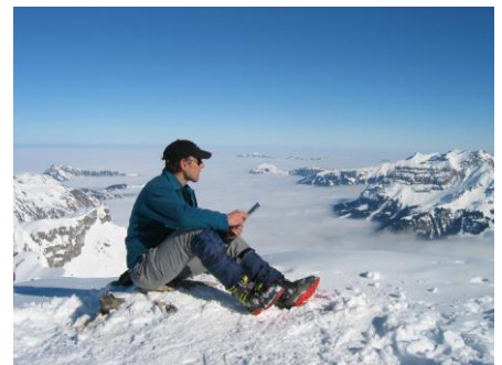
Rotsandnollen Februar 2003