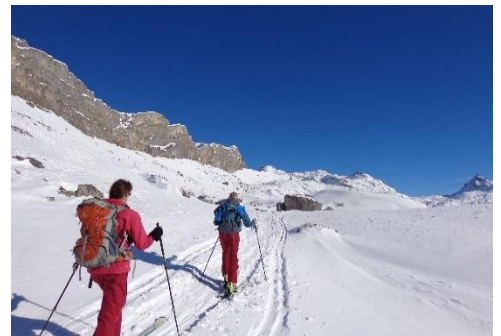
Langes flaches Stück entlang Hohmad (Reko 2023)

Abfahrt: Ab Tannenrotisand (P. 2536) geht's nordseitig via Schönboden, Heufrutt (P. 1896) und dann in bewaldetem, z.T. steilerem Gelände nach Oberboden, Schwend und weiter bis Stöckalp (1071m).