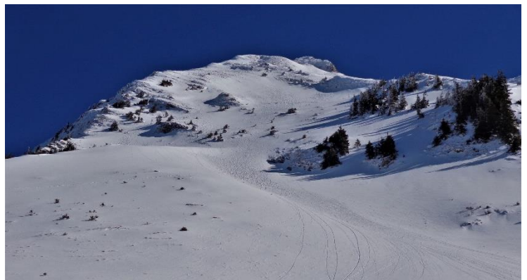
Südwesthang, 27.2.2022 (Gipfel nicht sichtbar)

Der Lütispitz bietet eine anspruchsvolle, sehr steile und zum Teil ausgesetzte Tourenmöglichkeit. Dementsprechend sollten die Verhältnisse und das Können sein. Die landschaftlich sehr schöne sowie abwechslungsreiche Skitour beginnt bei Laui und führt uns via Oberloui – längeres Flachstück – am Gräppelensee vorbei und über Hinderwinden Richtung Windenpass. Nach Erklimmen des Südwesthanges und 200m Gratstück erreichen wir den Gipfel.