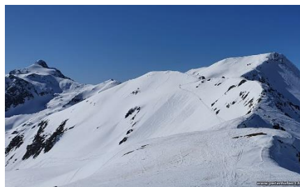
Piz Badus und Rossbodenstock