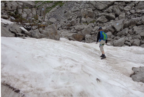
Zustieg zur Rigidalstockwand

Mit Ausgangspunkt Brunnihütte oberhalb Engelberg können vier Klettersteige begangen werden.