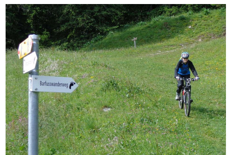
Bei der Reko Velofahrt hinunter.