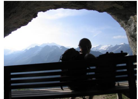
Felsnische nach halber Kletterstrecke

Gilt als erster Klettersteig der Schweiz, Schwierigkeit K3, 600Hm