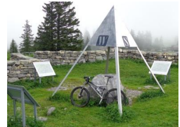
Am Mittelpunkt der Schweiz

Ankunft auf der Älggialp mit Restaurant und "geografischem Mittelpunkt" der CH – der berechnete Punkt liegt 500m weiter und 150m tiefer in felsigem Gelände.