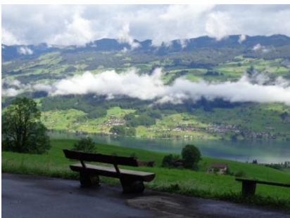
Aufstieg Richtung Mülimäs