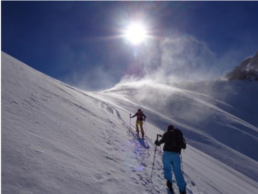
Querung der Bannalper Schonegg