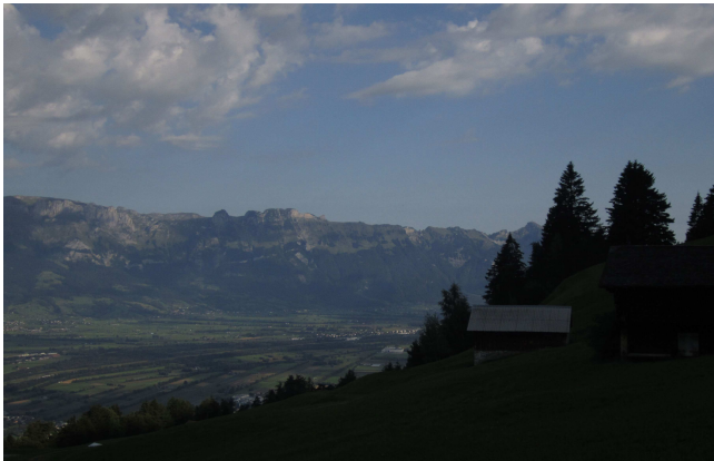
Blick ins Rheintal Buchserberg

Startpunkt ist Schaan, die eigentliche Tour beginnt und endet aber in Buchs. Der Aufstieg bis zum Buchserberg erfolgt grossteils auf Schotterstrassen kombiniert mit 2 kurzen aber technisch anspruchsvollen Trail-Passagen. Für die Abfahrt auf Single-Trails steht uns mit Roland Rick ein Kunden von mir als Tour Guide aus der Region zur Verfügung.