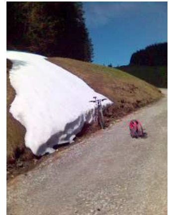
Letzte Schneefelder am Wegrand

Besonderes: LKs: 1:25'000, Zus'setzung 2510 / 1:50'000, Zus'setzung 5023