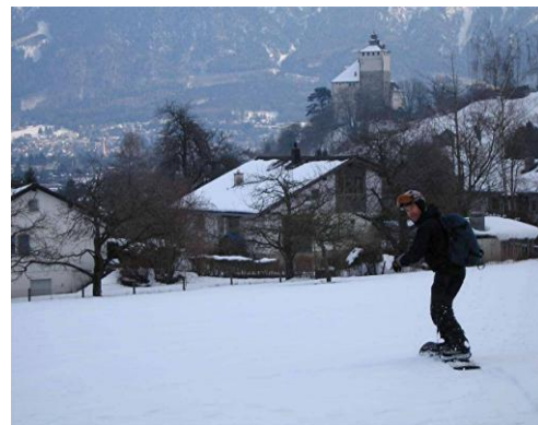
Abfahrt bis kurz vor Schloss Werdenberg, 17.2.2013)