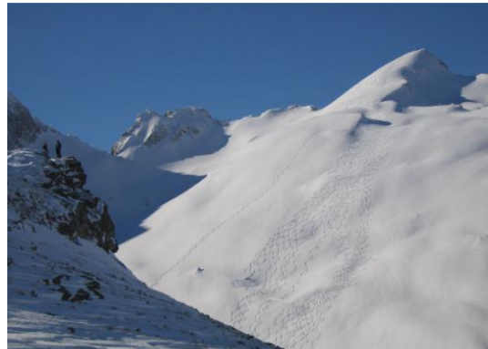
Rosswis (rechts im Bild, 17.2.2013)

LK 1:50000: Walenstadt (237 S) LK 1:25000: Buchs (1135)