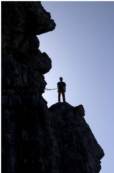
Zwischenhalt kurz vor dem Ausstieg