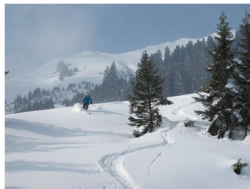
Reko-Ausweichtour (Vilan, Feb. 2012)