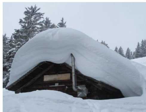
Mitte Februar 2012

LK 1:50000: Stans (245 S) LK 1:25000: Engelberg (1191), Schächental (1192)