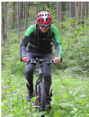
Cédric Richtung Schleitheimer Randenturm

Kosten: Je nach Anreiseart, Fahrspesen nach Ansätzen Berg & Ski.