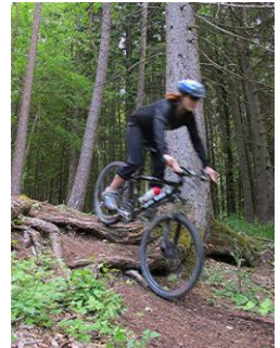
Carole Richtung Randenhütte

Es gibt mehrere Pausen um Natur, Aussicht und vielleicht ein Bierchen (oder wenn nötig heisse Suppe...) zu geniessen.