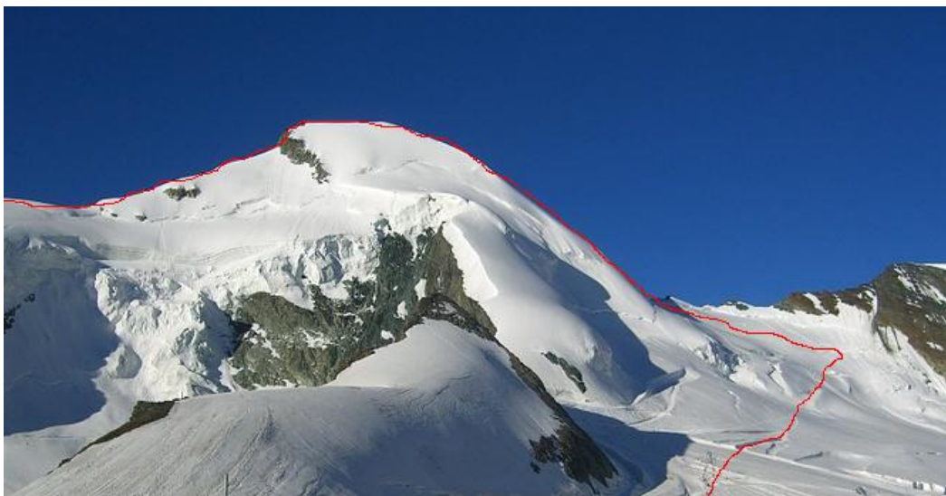
Aufstieg Allalin via Normalroute, Abstieg via Hohlaubgrat.

Der Klettersteig aufs Jegihorn bietet neben der schönen Kletterei auch eine faszinierende Aussicht auf das Panorama von Wiesmies, Allalinhorn und der Mischabel-Gruppe. Von der Station Kreuzboden ist der Einstieg in einer Stunde erreicht, bis zum Gipfel benötigt man dann nochmals 2 – 3 Stunden. Wem der Klettersteig zu einfach ist kann auch die Kletterroute auf das Jegihorn nehmen.